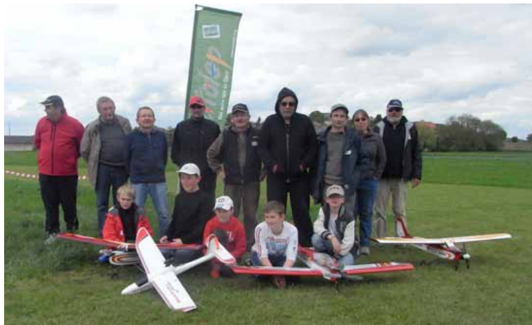
mercredi 29 avril 2015... 3 pilotes sont absents