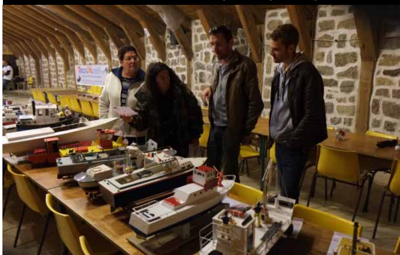
Les juges maquette en plein travail...